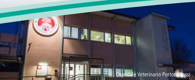
Ospedale Veterinario Portoni Rossi